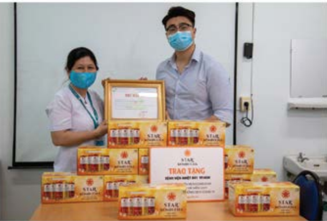
Star Kombucha tặng quà đến bệnh viện Bệnh nhiệt đới để tiếp sức cho y bác sĩ tuyến đầu.